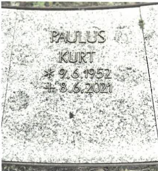
Beschriftung - Muster