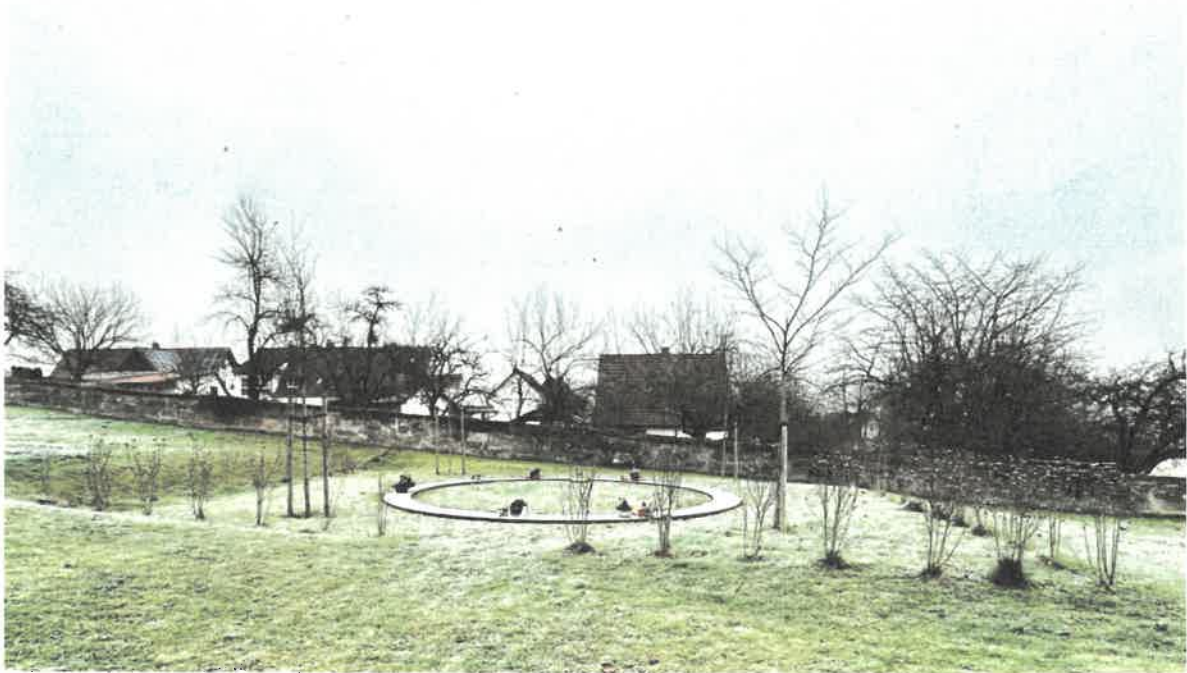
Urnenanlage "Ring", Friedhof Rentweinsdorf