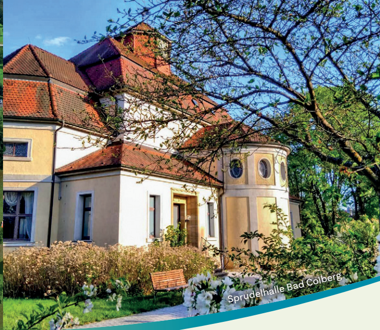
Sprudelhalle Bad Colberg