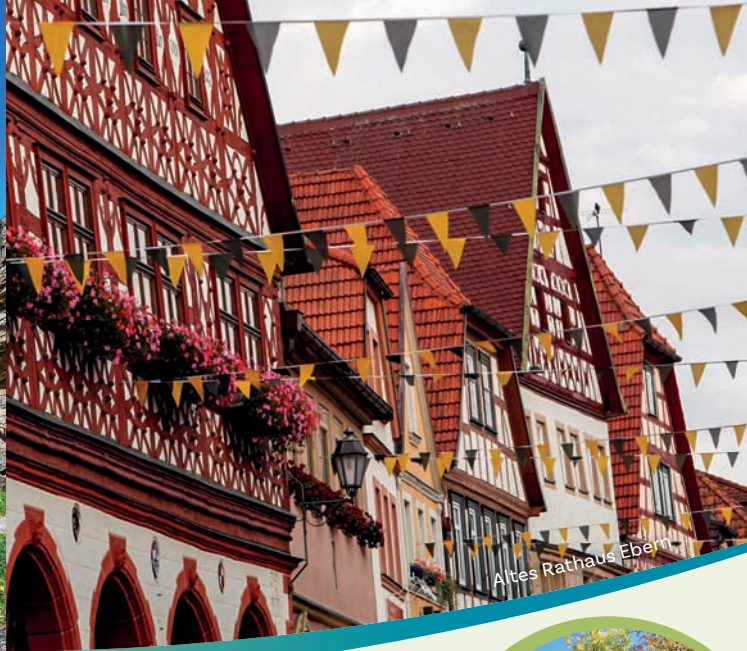
Altes Rathaus Ebern