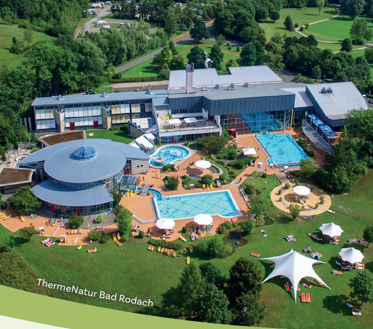
TherneNatur Bad Rodach