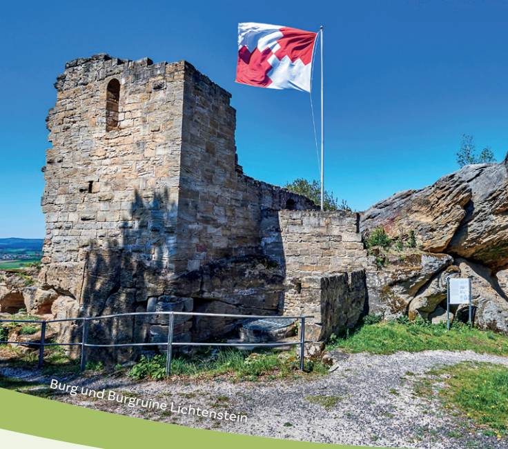
Burg und Burgruine Lichtenstein