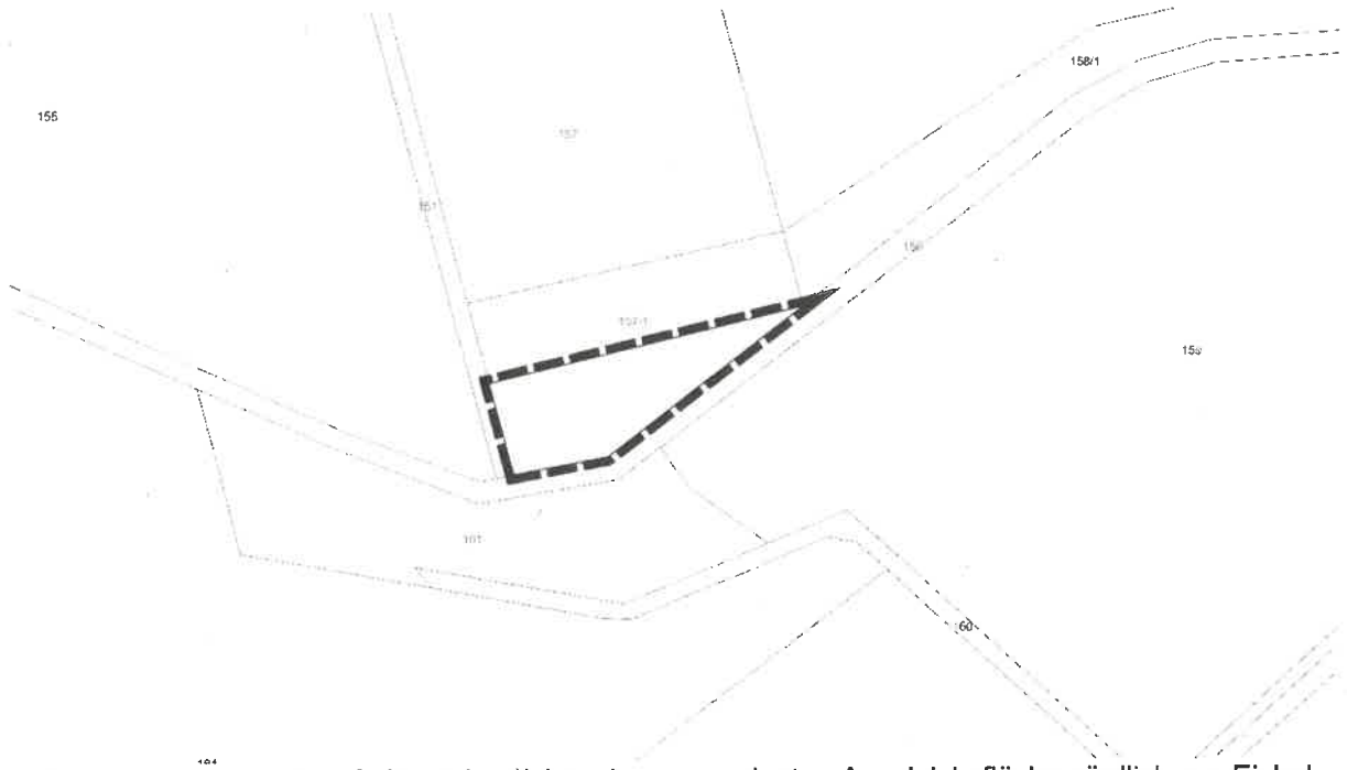
Lageplan des räumlichen Geltungsbereiches der zugeordneten Ausgleichsfläche nördlich von Eichelberg entlang des Hinterbachs (Fist. Nr. 156) o. M., (Kartengrundlage Geobasisdaten © Bayerische Vermessungsverwaltung 2025)